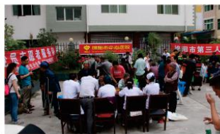
2016年6月24日，我院党员志愿者服务队一行6人，赴平武县锁江乡槐窝村开展精准扶贫义诊活动。

精准扶贫工作的机构机制健全后，院党委又制定了“全面落实省、市精准扶贫政策；努力完成对口帮扶贫困县、乡镇、社区（含对口支援）医疗机构帮