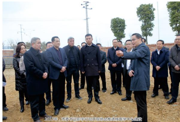
2017年，市委市领导莅临召开现场会推进核医学中心建设