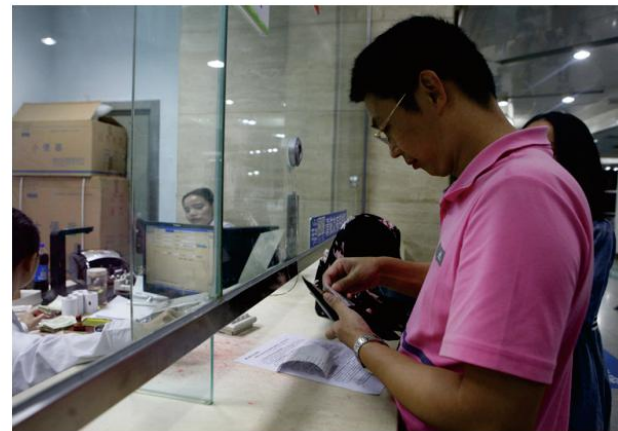
2016年10月1日，医院正式实施药品零加成，城区一男子带着发烧女儿来我院就诊，成为我院实施药品零加成后接待的第一位患者。

从9月23日起，医院召开了7次项目专题会议，对各个方面细节及流程进行了安排部署。为让更多患者知晓这一惠民政策，医院组织医务人员认真学习相关政策，并通过在诊疗过程中向患者宣传及告知、印制宣传资料在门诊咨询台发放，通过院内设置的显示屏滚动告知，利用网站、微